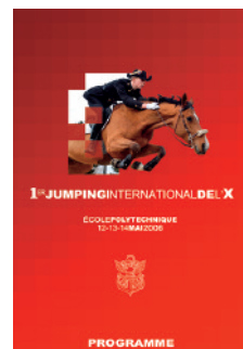
A4 document fini une fois coupé au 210 x 297 mm