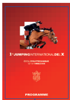
A4 document imprimé avec fond perdu pas encore coupé 216 x 303 mm